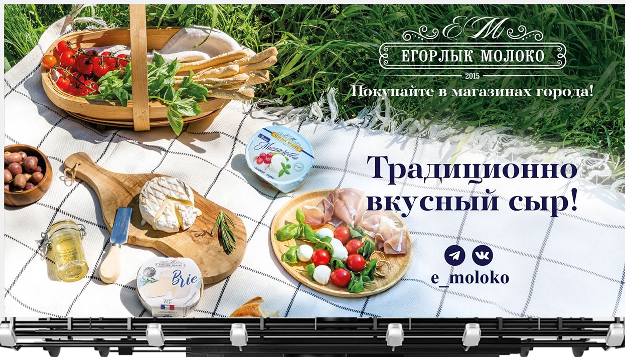
Наружная реклама «Егорлык Молоко»